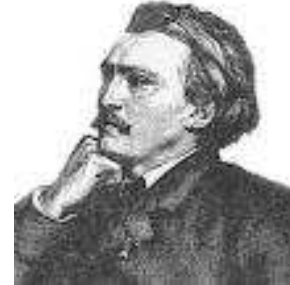
Gustave Doré (1832-1883)

En 1798, Coleridge publie avec Wordsworth, Les Ballades lyriques , qui contiennent le célèbre poème The Rime of the Ancient Mariner traduit en français par La complainte du Vieux Marin .