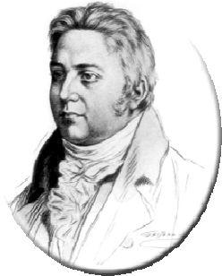
Samuel Coleridge (1773-1834)